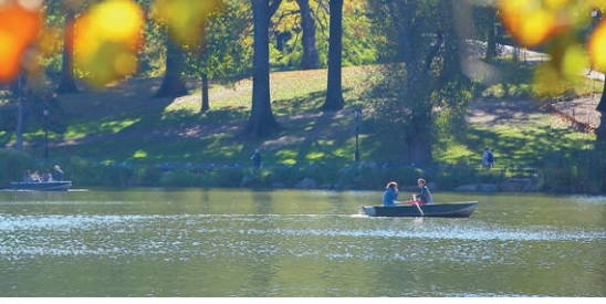
ボツカリとのんびりした日溜まりが小春日和の水面に漂う

工場も取材して臨み、クルーシヤンやものづくりの根底にある武士道やおもてなしといった精神性も伝えることができたと思えます。午後はグループ別の討論会などが行われた。同日は参加6校がニ