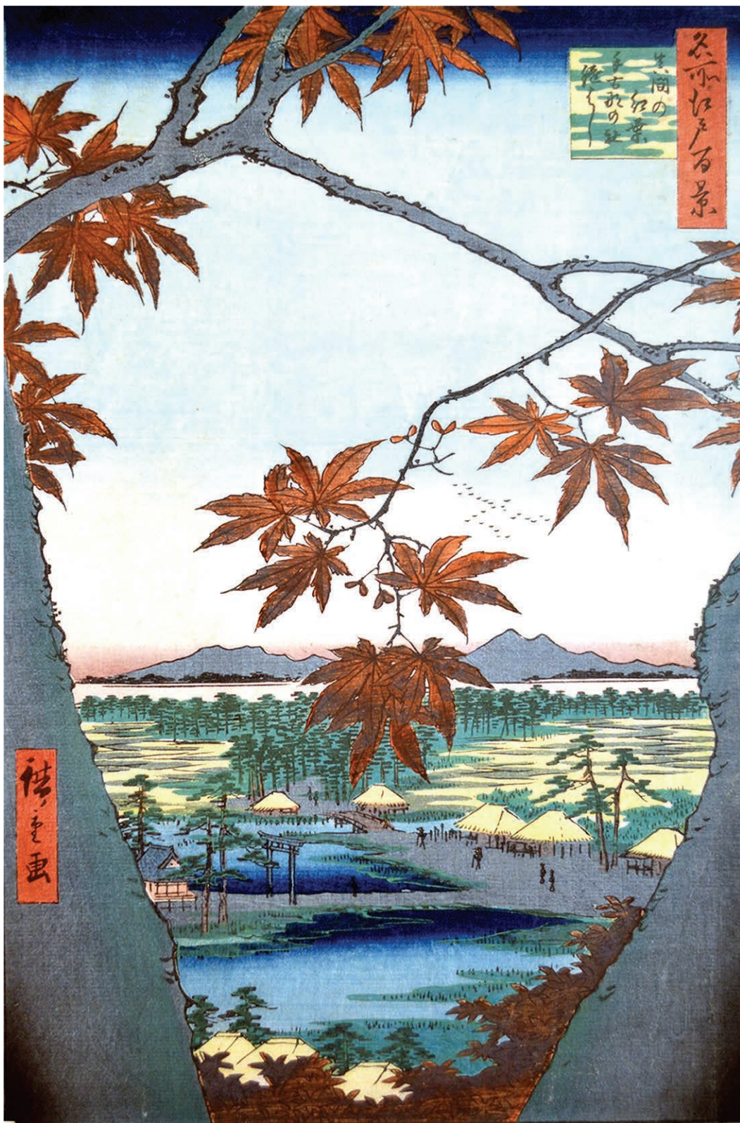
"Maple Trees at Mama" by Hiroshige from the series "One Hundred Famous Views of Edo," printed in 1857. 『名所江戸百景』より「真間の紅葉手古那の社つき橋」

市内制限速度 時速25マイル ニューヨーク市内の90%の道路が7日、従来の時速30マイルから25マイルとなり、新表示「90%の道路が7日、従来の時速30マイルから25マイルとなり、新表示」の設置が始まった。14日までの市内の出入口を中心に、89枚の新しい速度制限表示が設置される予定。 市長の「ビジョン・ゼロ」計画の一環。同計画の実施により今年、同計画のデータによると、1月からの9月までの歩行者の交通事故死は93人、負傷者は864人から777人に減少している。 一方、同時期のサイクリストの事故は死亡が7人、30人、58人と急増。事故発生して340件発生して均して340件発生して